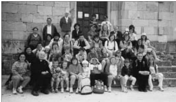
I ragazzi, le catechiste e alcuni adulti sulla gradinata del Santuario di San Vittore, dopo la Messa.

La gita catechistica 2010 ha scelto due mete interessanti e belle: il Santuario di S. Vittore e Corona e il Museo dei sogni a Feltre. Il Santuario, posto in alto su uno sperone di roccia, risale al 1100 e ha una storia millenaria e gloriosa. All'interno racchiude la preziosa urna con le ossa dei due martiri: Vittore soldato romano e Corona una giovane che si convertì vedendo il coraggio di Vittore affrontare torture e la morte.