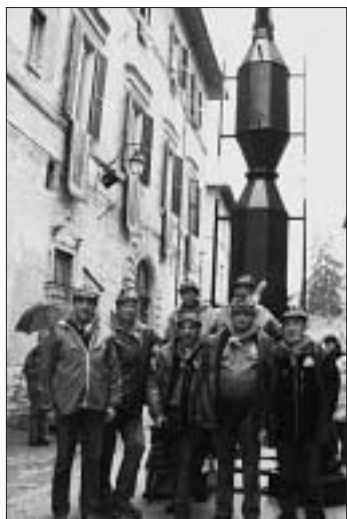
Gubbio gli Alpini davanti al "Cero di S. Antonio".

dopo un incontro con l'Amministrazione Comunale abbiamo potuto alloggiare in una palestra.