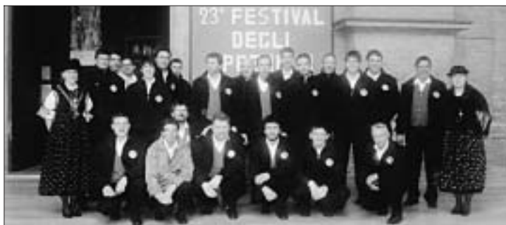
Il coro sulla scalinata della Basilica di S. Maria Assunta.

Molto apprezzata è stata anche la coreografia delle ragazze in costume ladino. Solo