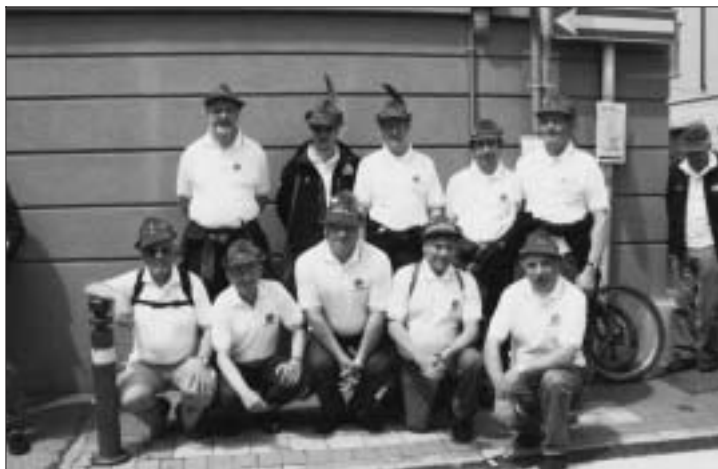
Bergamo: Alpini fodomi con la maglietta bianca, nuova divisa della sezione di Belluno.