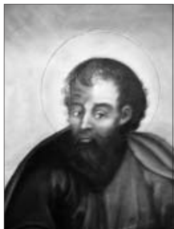
Gonfalone della Chiesa di Arabba, San Paolo.

Essi sono i Patroni da sempre della vallata di Liviallongo, ai piedi della chiesa a loro dedicata sul Plan degliejia vegla , venivano sepolti tutti i battezzati da Caprile, Colle, Pieve e tutte le frazioni circostanti attraverso I teriol de i morc .