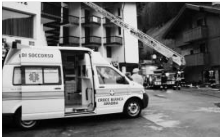
Simulazione di incendio - con i pompieri di Selva di val Gardena.