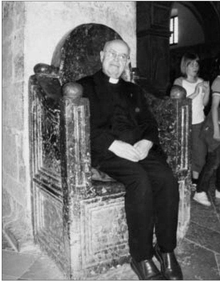
Il Decano seduto sulla famosa Cattedra del Vescovo a san Vittore, che dicono faccia passare il mal di schiena!