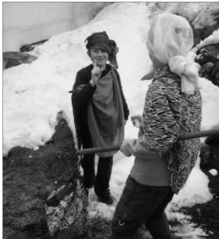
I bambini impegnati nella rappresentazione della parabola del "Figliol prodigo", organizzata dalle suore.

Ciò che non deve concludersi è il nostro impegno a pregare incessantemente, affinché il Signore faccia crescere anche nella nostra Chiesa diocesana tante e sante vocazioni al sacerdozio, e a la-