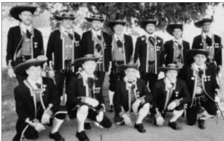
La folta schiera degli Scizeri che hanno fatto da scorta d'onore al Santissimo lungo il tragitto della processione.