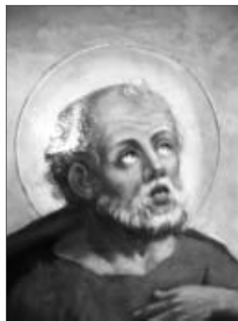
Gonfalone della Chiesa, San Pietro.

Protegete la nostra valle, e la fede delle nostre famiglie!