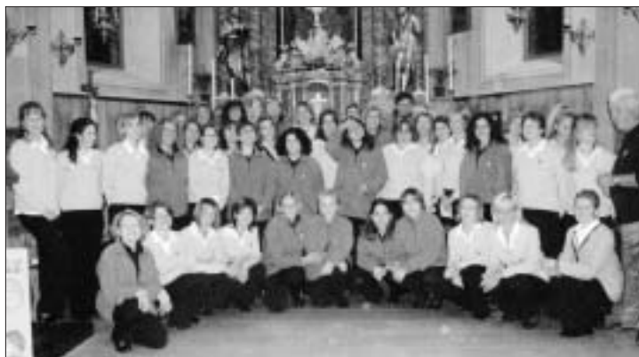
Coro Dolci Armonie di Parma ad Arabba il 19. 09. 2009.