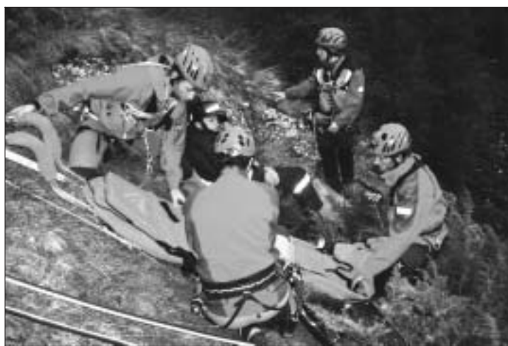
Simulazione di incidente stradale - con il soccorso alpino.