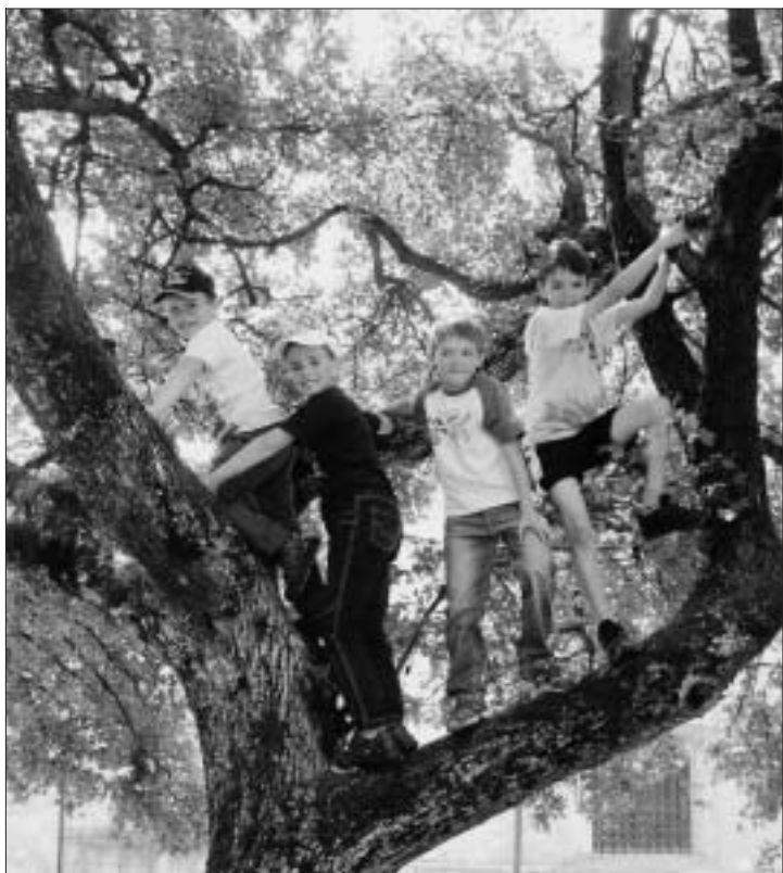
Gita di fine catechismo al santuario dei Santi Vittore e Corona a Feltre: chi riconosce i nostri “scoiattoli”?

quattro evangeli e benedizioni, tanto quanto il giorno del Corpus Domini. Quest'anno gli scizeri han dovuto farsi aiutare da alcuni uomini e giovani presenti per portar fuori tutto il necessario per la processione. Ancora una volta Arabba paga lo scotto di essere frazione, e quindi nelle maggiori feste vedere l'esodo delle curazie verso la Pieve. Ma fin quando si riuscirà a tener duro, noi non molteremo. Poi faremo quel che riusciremo.