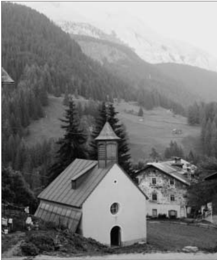
Cappella di Chertz "liberata" dal grande frassino e dagli abeti.