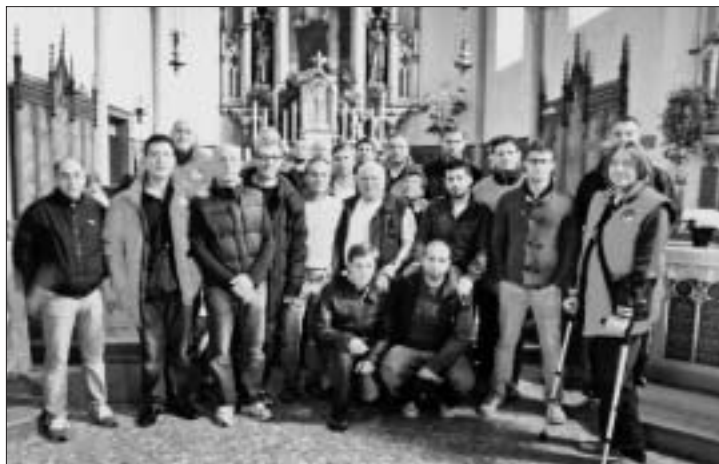
Il coro "La Cordata" dopo la S. Messa.