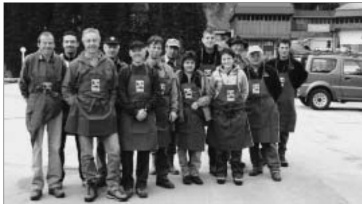
Il gruppo dei volontari della zona di Arabba con il caratteristico "gurmél".