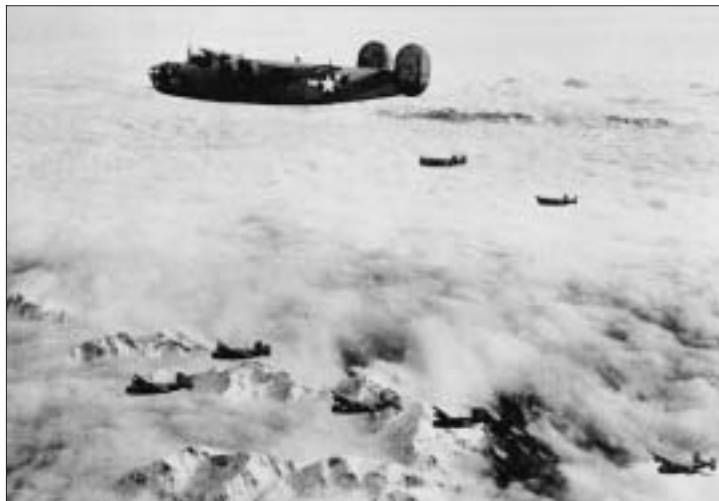
Il B-24D Liberator in volo verso l'obbiettivo in territorio germanico.

Oltre a quello del Pizac, altri due caddero in territorio ladino; uno a Pian dei Schia-