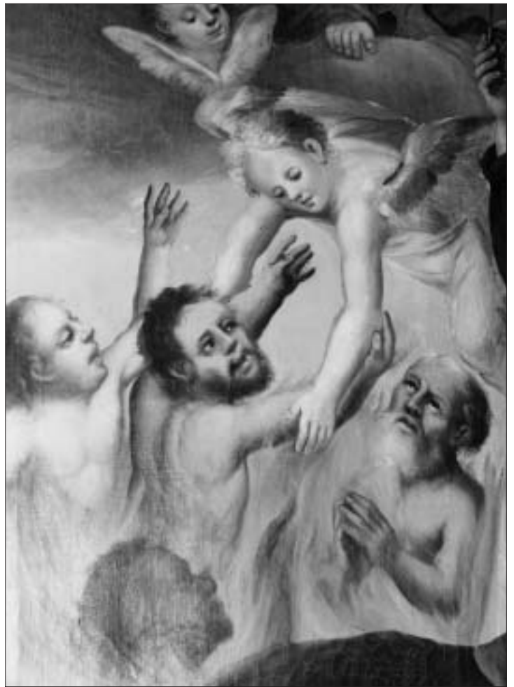
Pala dell'altare del Carmine: particolare con le anime del Purgatorio.

Davanti alla Madonna che consegna lo scapolare a San Simone Stock, hanno pregato generazioni non solo di Arabba, ma di tutta la vallata di qua e di là del passo Campolongo. Di fronte a questa statua e a questo