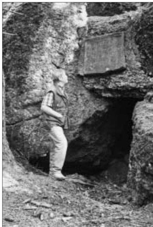
All'entrata di una galleria, un'incisione su un getto in cemento, ricorda il tempo di guerra.

Visita a 4 reparti di operai a Incisa. Nel pomeriggio vengono incendiate Arabba e Varda da