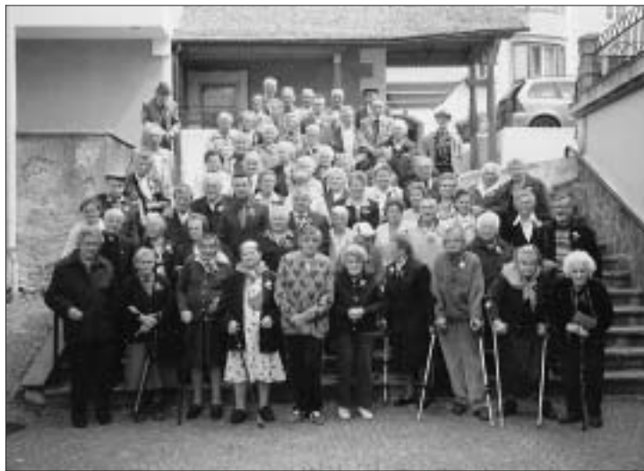
Pieve: un gruppo dei 90 anziani, il 13 giugno, dopo la Messa celebrata per loro.

All'ottimo pranzo, consumato all'Hotel Alpenrose, offerto generosamente dall'Amministrazione comunale, il Sindaco è passato a salutare uno per uno gli anziani e a offrire un piccolo omaggio: un mazzo di carte da gioco per gli uomini e alle donne un vaso di miele per lasciare un ricordo "dolce" della bella giornata trascorsa insieme.