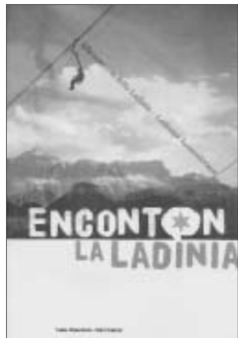
La Copertina del Liber.

Co vade ncora fòra per le scòle l'è dit ncora, ai tosac i è conte le lejende ladine, che i genitori no conta plu ai tosac. Nveze i è de gran mportánza, perciéche i è storie liade al teritório. De personagi che se veiga a la televijion n'on ben assè. Pense che chëst siebe n liber che fossa polito che nta Fodom l vade ence nte le scòle, se se ciefieia. Ma mpruma l desse ai genitori de la Ladinia, ai Ladins. L'autrize del liber, l'è conté