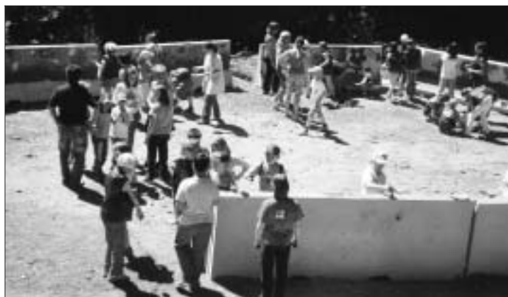
I "New Jersey" dipinti dai bambini.