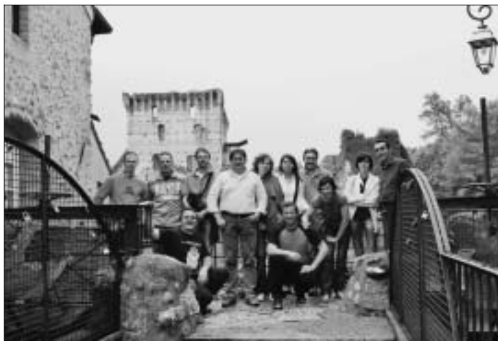
Gita della classe 1970.

Il traguardo degli "anta" non può certo passare sotto silenzio. Così i coscritti della classe 1970 si sono ritrovati per trascorrere due giorni insieme. Peccato che molti dei 29 neo quarantenni non abbiano potuto partecipare, soprattutto per motivi di lavoro e così la combriccola si è ristretta ad una dozzina. Come gli apostoli. Ma l'allegria non è certo mancata, segno che gli anni non hanno intaccato lo spirito.