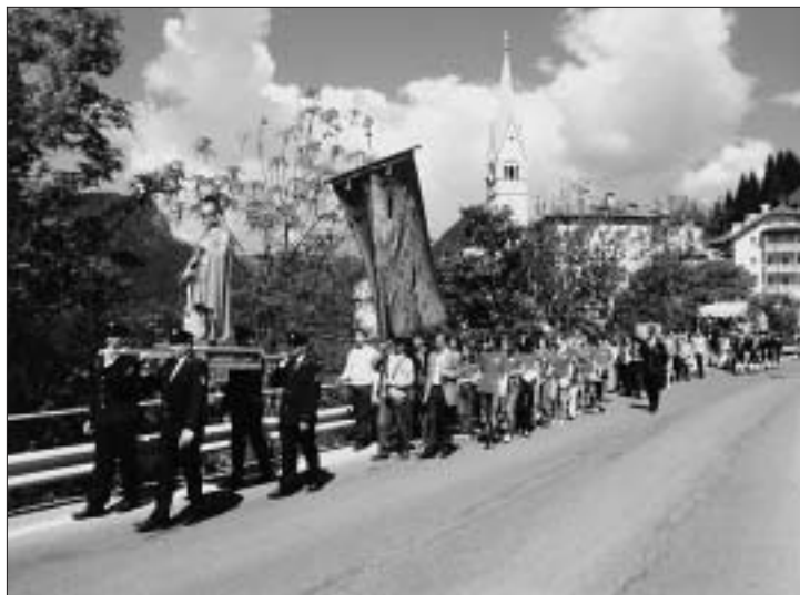
La lunga processione: all'inizio vediamo i pompieri che portano la statua del loro patrono san Floriano.