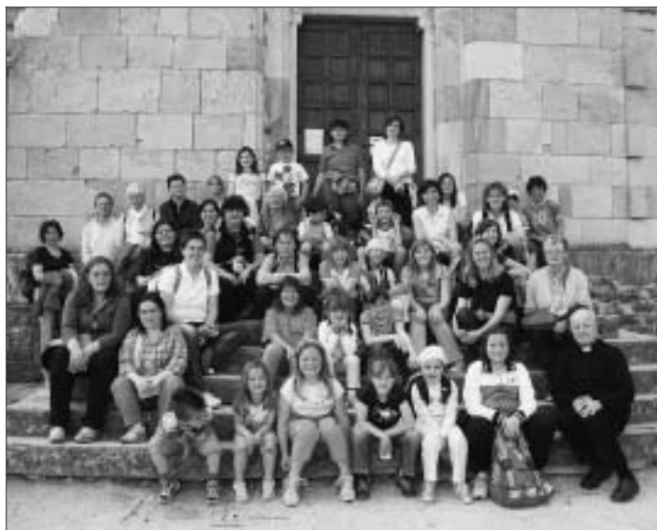
Foto di gruppo davanti al portone della Basilica di San Vittore il 2 giugno 2010.

La Parrocchia di Arabba ha appoggiato e collabora volentieri con un gruppo di volenterose mamme, che si sono organizzate per un centro estivo a favore dei figli di residenti che lavorando