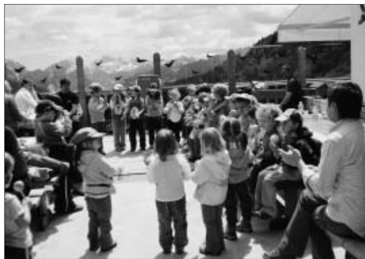
La canzoncina dei bambini della scuola dell'infanzia.

Un terzo momento proposto a tutti i bambini ha invece riguardato una breve esercitazione con simulazione di spegnimento di incendio boschivo cui hanno preso parte uomini del Comando Provinciale dei Vigili del Fuoco di Belluno con 4 unità del Distaccamento Volontario di Colle S. Lucia e uomini del Corpo Forestale dello Stato con l'intervento di un elicottero appositamente attrezzato.