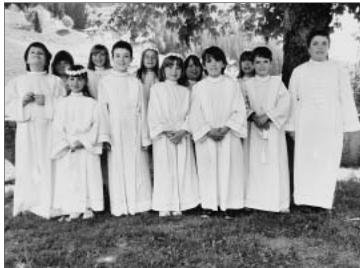
Innumerosi bambini della Prima Comunione, contenti di aver aperto la processione del Corpus Domini portando le statue di Gesù bambino e di Santa Teresina.

Il Corpus Domini è una delle feste più sentite e partecipate dal popolo cristiano.