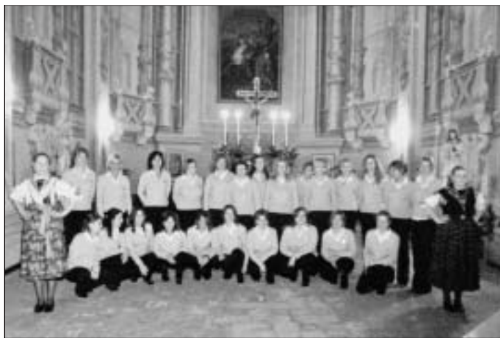
Concerto alla Certosa di Parma.