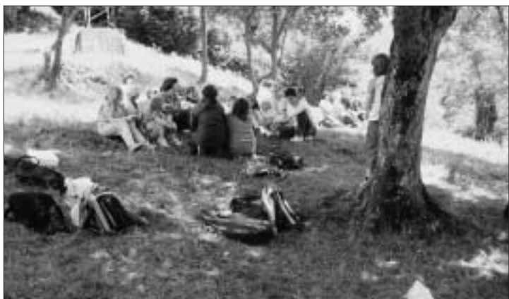
All'ombra di un bell'albero, in mezzo al prato, una chitarra, tante voci, un'unica allegria!

Un buon lavoro, e chesia la prima di molte estati piene di soddisfazioni e gioia di stare insieme.