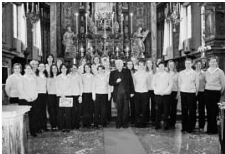
Accompagnamento della Santa Messa nella Chiesa di Santa Maria della Steccata.