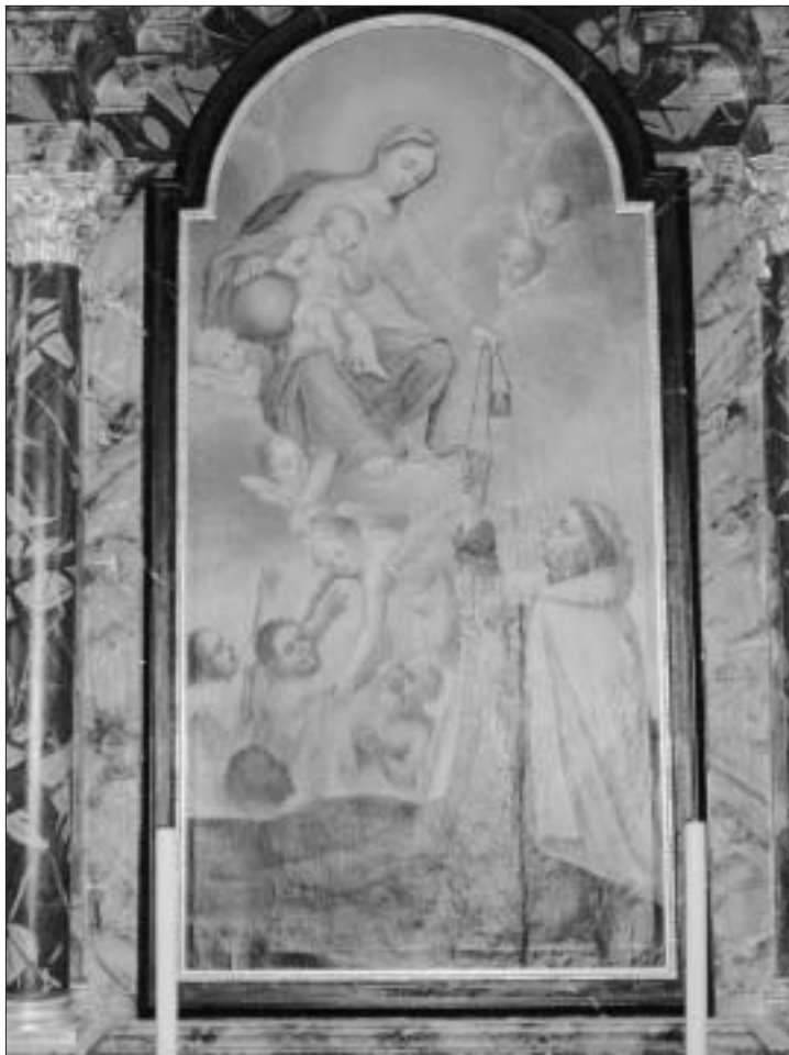
La pala dell'altare della Madonna del Monte Carmelo.

Quando andiamo davanti all'altare di Arabba, preghiamo con fiducia la Madonna, ma soprattutto diciamo che ci aiuti a ben confessarci e ben comunicarci a favore dei nostri cari defunti.