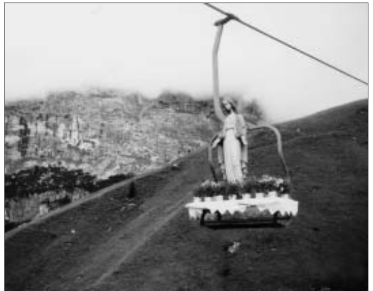
La Madonna dei Bec de Rocces, 15 agosto 1992: la statua della Madonna sale ancorata al seggiolino dell'impianto di risalita verso i Bec, dopo essere stata in Chiesa ad Arabba ad accogliere con le sue braccia aperte e gli occhi bassi le invocazioni dei suoi figli. Anche quest'anno Ella ci attende per Santa Maria Maiou ad Arabba e sui Bec.

Una bellissima giornata ci ha assistito per la Messa solenne e la seguente processione sulla piazza di Freine per la