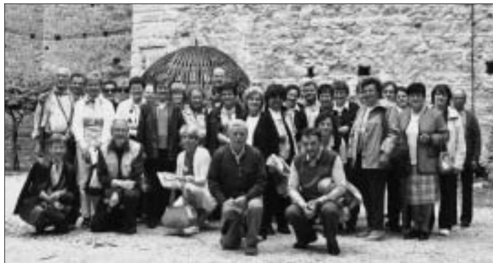
Gita classe 1942 e amici a Marostica.

Quindi salita a piedi al Castello Superiore per godere