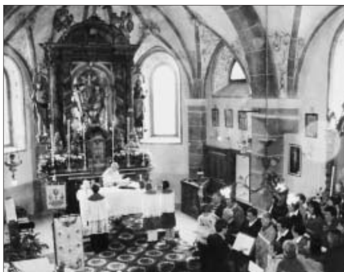
Un momento della celebrazione solenne.

Il 30 maggio scorso abbiamo celebrato la solennità della Santissima Trinità.