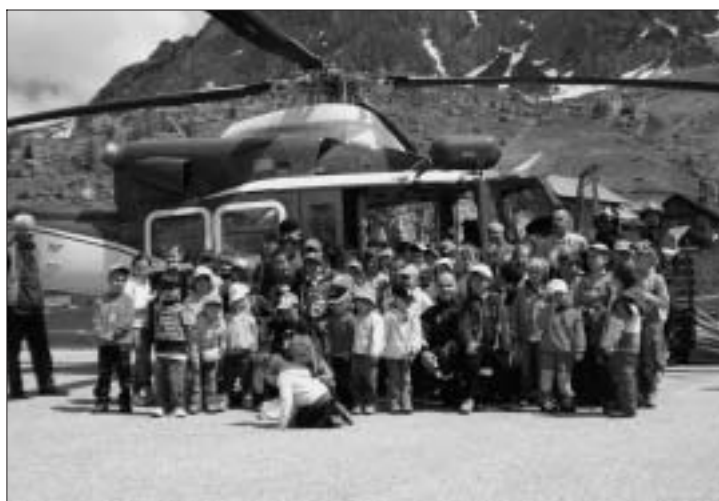
Bambini ed elicottero forestale.